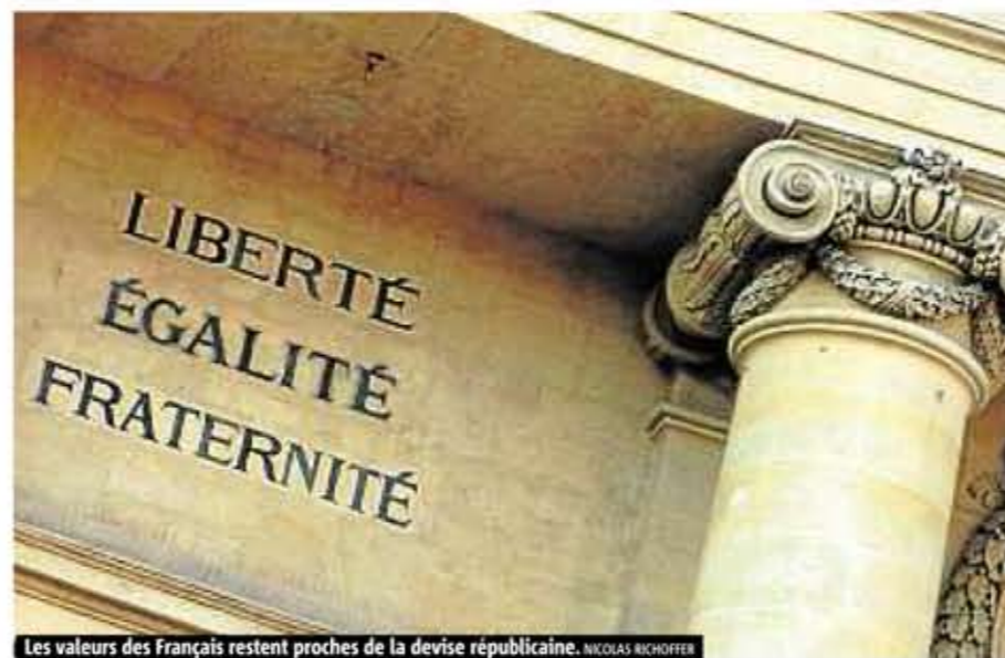
Les valeurs des Français restent proches de la devise républicaine. NICOLAS RICHOFFER

* Institut d'études et de conseil spécialisé dans le discours, la communication et les médias